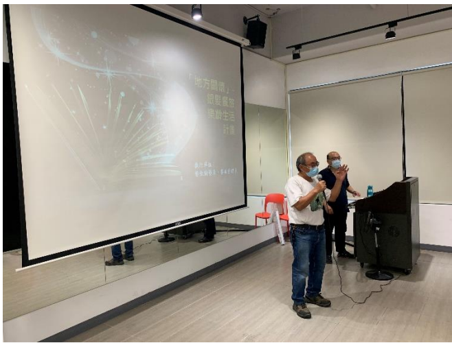
社區發展協會總監分享 (1)