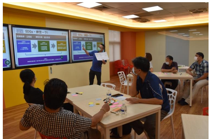
王老師分享自己的設計思考課程的架構圖是如何產生，並給予每人一張自己設計的架構圖海報，讓老師們在研習結束後可運用於自己的課程作為參考。