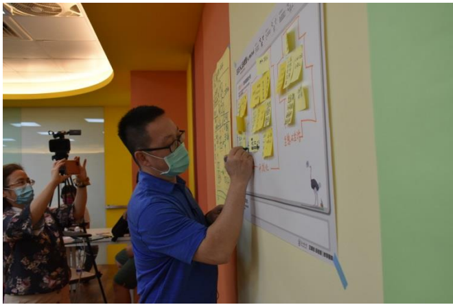
王老師協助研習老師們將分群好的便條紙做群組命名。