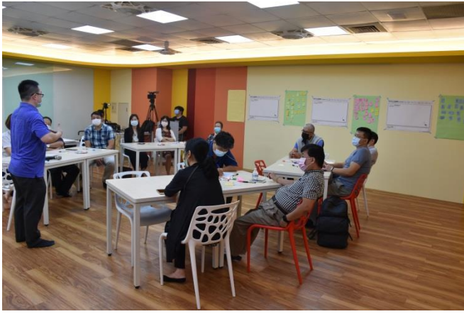
王老師接著介紹 KJ 法的原理、如何實際應用以及運用的時機。