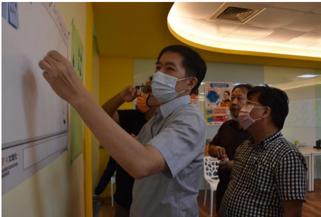
研習老師們將第三個類別的海報便利貼按照內容相關性作分群。