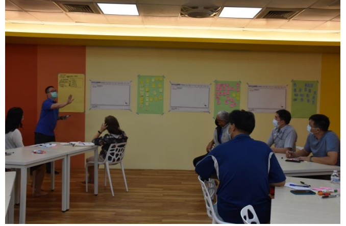
王老師以「教室」為主題來當作 KJ 法的範例，為研習老師們作簡單的解說。