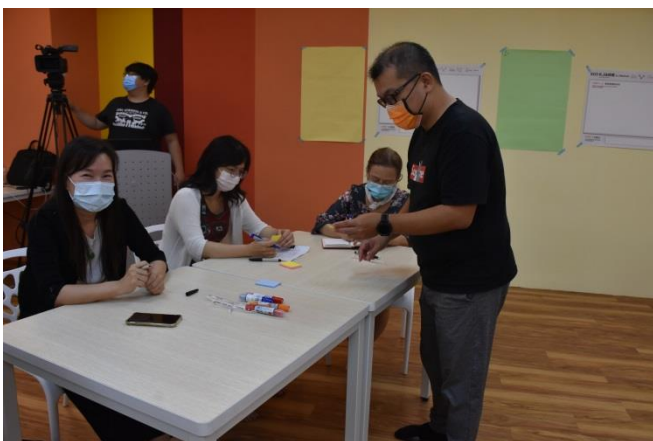
教資中心的同仁協助收紙條並依序貼在後方的海報紙上。