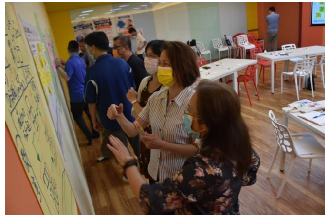
研習老師們做完分群以後將每個群組加以命名。