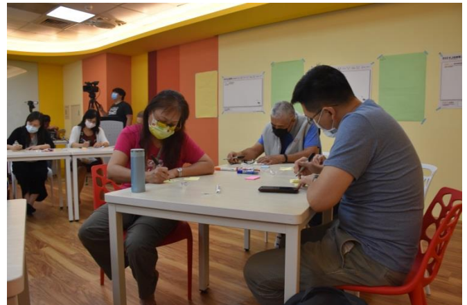
研習老師們非常認真的寫下自己的想法。