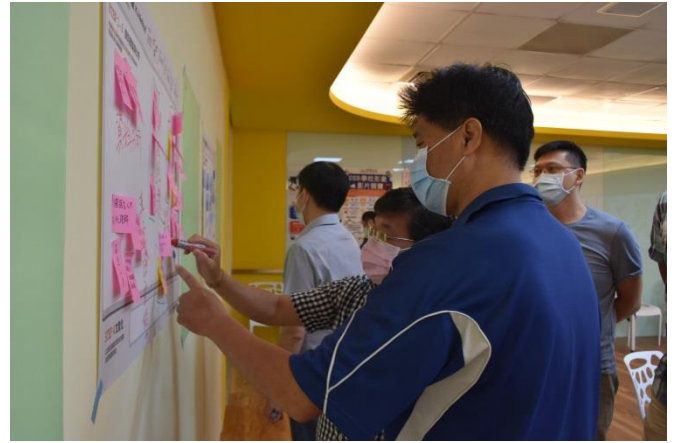
研習老師們將第二個類別的海報便利貼按照內容相關性作分群。