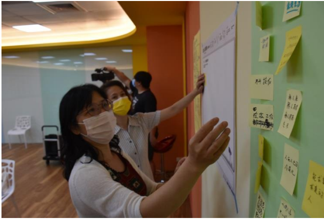
研習老師們將第一個類別的海報紙便利貼按照內容相關性作分群。