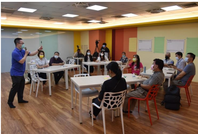
王老師準備許多教材邀請在場的老師一同使用苗圃計劃裡的設計思考模式來探討未來的教育。