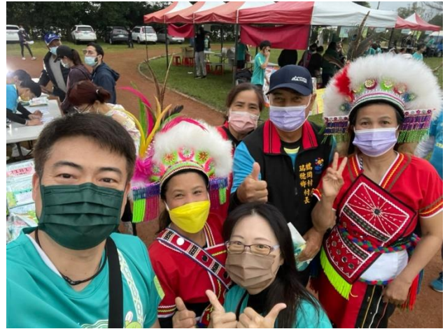
《圖說》花蓮縣瑞穗鄉「柚花追香」路跑活動，部落居民熱情招呼，讓來自台北的師生感到一股溫馨。