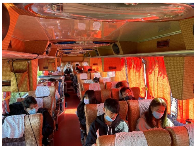
車上驗收課程成果