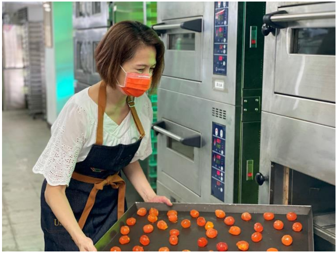
教師製作料理過程