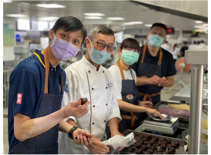
教師製作料理過程