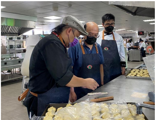
教師/學生聆聽示範