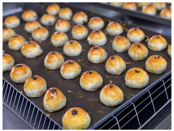
伴手禮產品實作呈現