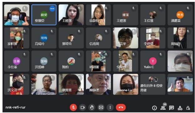
與會人員大合照，及 Q&A